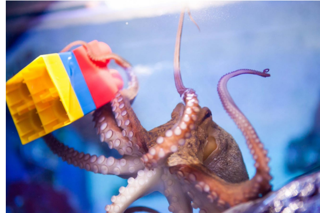
Un pulpo jugando con un juguete en su pecera.

En un acuario de Estados Unidos, un pulpo llamado Sammy se divertía jugando con una pelota de plástico que podía montarse girando las dos mitades. Su cuidador ponía comida dentro de la pelota y Sammy la abría, se la comía, y volvía a cerrarla cuando había terminado.