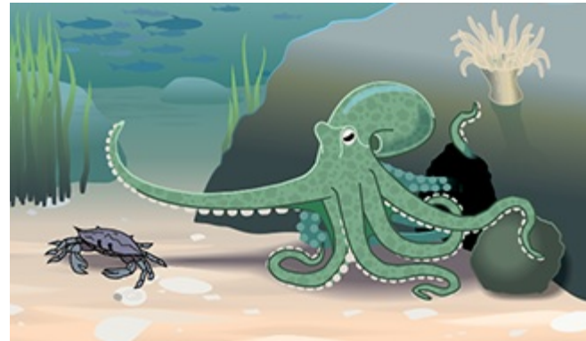
Un pulpo delante de su guarida.

Los pulpos suelen vivir solos en guaridas que construyen con piedras e incluso suelen colocar "puertas" en ellas, que cierran para estar a salvo.