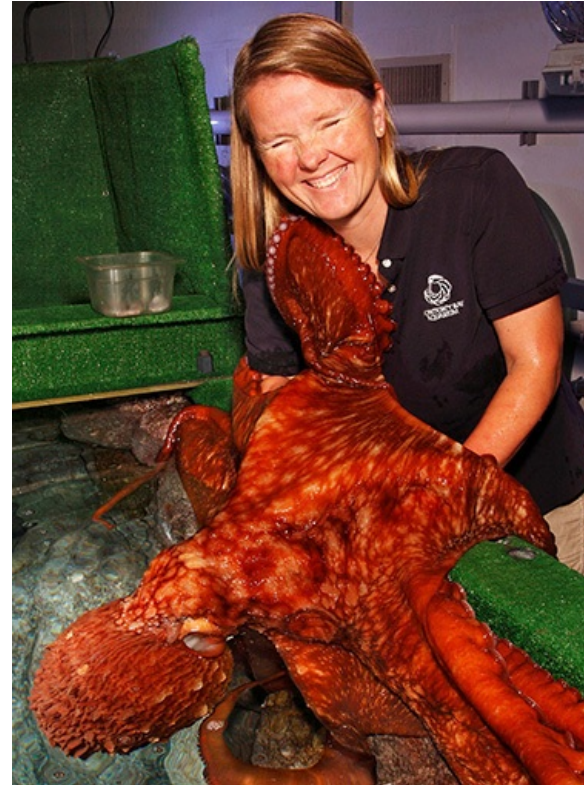
Un pulpo aferrándose a los brazos de su cuidadora.

A los pulpos les gusta la compañía tanto como la comida. Cuando los pulpos terminan de comer, levantan un tentáculo y luego otro, abrazando las manos y los brazos de sus cuidadores. Los pulpos y los cuidadores se abrazan mientras los pulpos se aferran a los cuidadores con sus ventosas.